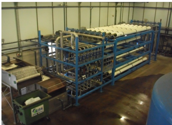
Foto 4: Productie van mineralenconcentraat d.m.v. omgekeerde osmose