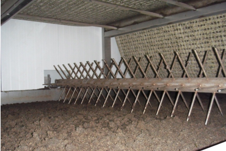
Foto 3: Binnenzijde van platendroger voor dikke fractie digestaat van covergisting waarbij gebruik gemaakt wordt van teruggewonnen restwarmte van de WKK

Het eindproduct van het droogproces heeft een ds-gehalte van meer dan 80%. Dit product is geschikt om tot korrels te persen. Na het persen wordt een hittebehandeling toegepast om een stabiele en hygiënische korrel te verkrijgen. Sanitatie kan overigens ook vóór het drogen plaatsvinden. Mestkorrels vinden meestal afzet buiten Nederland.