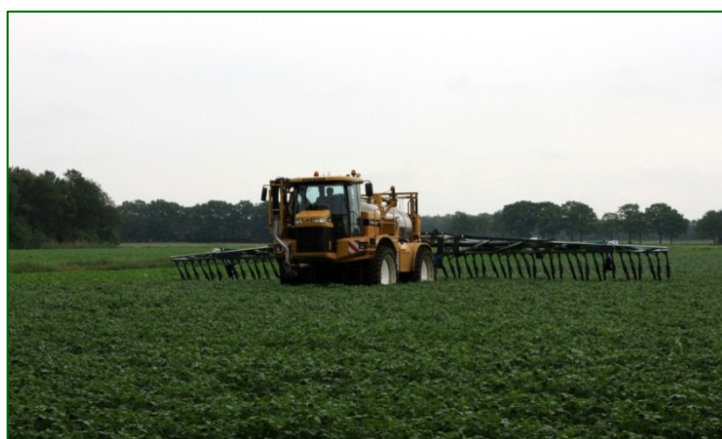
Foto 5: Machine voor aanwending van mineralenconcentraat, hier in aardappelgewas