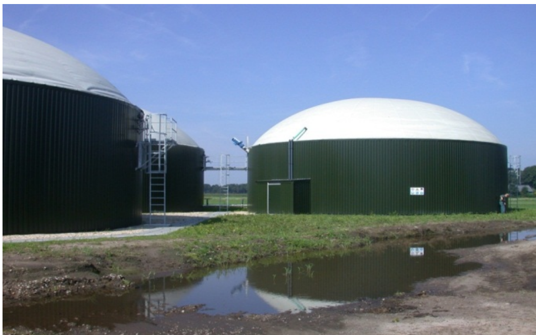
Foto 1: drie reactoren van een covergistingsinstallatie in Heeten (Ov.)

De schaarste aan hoogenergetische grondstoffen, die geschikt zijn voor co-vergisting, wordt onder andere veroorzaakt doordat een deel van deze producten verdwijnt naar ons omringende landen, waar er een hogere prijs voor wordt betaald. Dit heeft te maken met verschillen in subsidieregelingen tussen Nederland enerzijds en Duitsland en België anderszijds, waar de condities aanzienlijk gunstiger zijn met hogere subsidieniveaus en een langere subsidieperiode. Het gevolg van deze ongelijkheid is dat interessante co-producten (reststromen) die hier vrijkomen niet voor Nederlandse vergisters beschikbaar zijn. Dit betekent dat gezocht moet worden naar alternatieve grondstoffen voor co-vergisting. Deze zullen vaak minder makkelijk anaeroob afbreekbaar zijn omdat ze een hoog gehalte aan lignocellulose bevatten, zoals maïsstengels en natuurgras, waardoor een voorbehandeling noodzakelijk is.