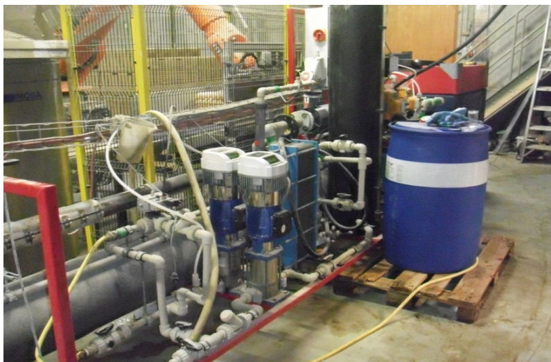
Foto 6: Proefinstallatie voor TMCS op mineralenconcentraat