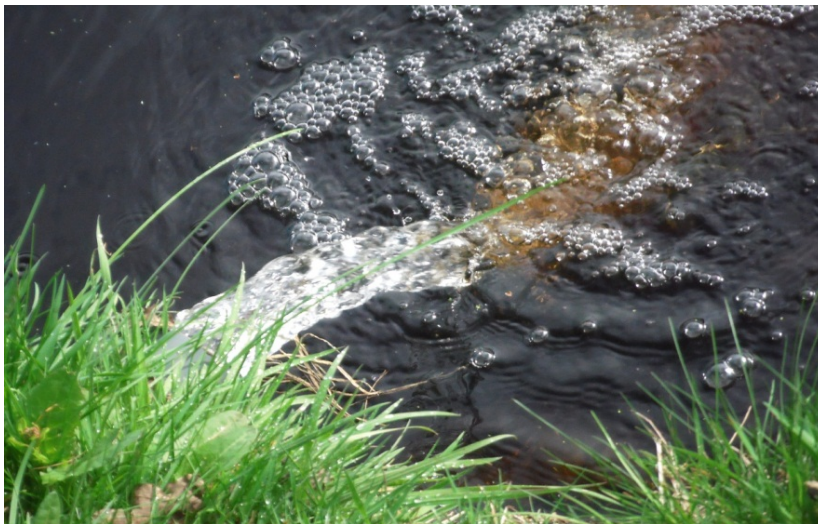
Foto 7: lozing op oppervlaktewater van het permeaat van omgekeerde osmose na polishing d.m.v. een ionenwisselaar

Andere afzetoptyes voor het behandelde water zijn: lozing op het riool en toepassing in de landbouw als irrigatie- of schoonmaakwater.